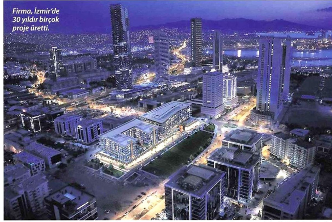
Firma, İzmir'de 30 yıldır birçok proje üretti.

Bizim için müşteri memnuniyeti her zaman birinci öncelik. Avcılar olarak projelerimizin hovutuna ve zorluğuna