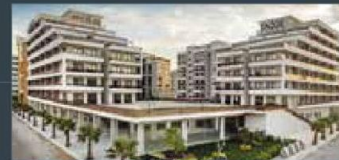
Avcılar Cadde Teras Bornova