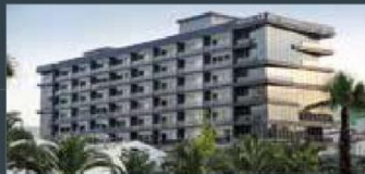
Avcılar Lobi Parlas Residence